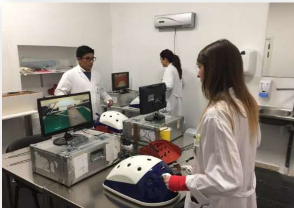
Imatge 1. Residents del Servei de Cirurgia realitzant pràctica d'introducció a la laparoscòpia en el Laboratori d'Habilitats del servei.