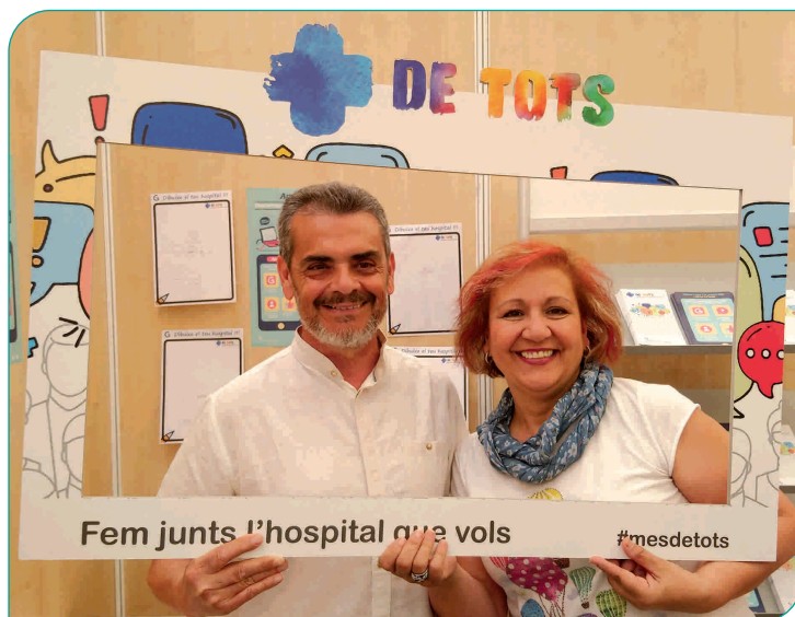
Dos ciutadans fent-se una fotografia a l'estand de l'Hospital de la Fira de l'Ascensió 2019