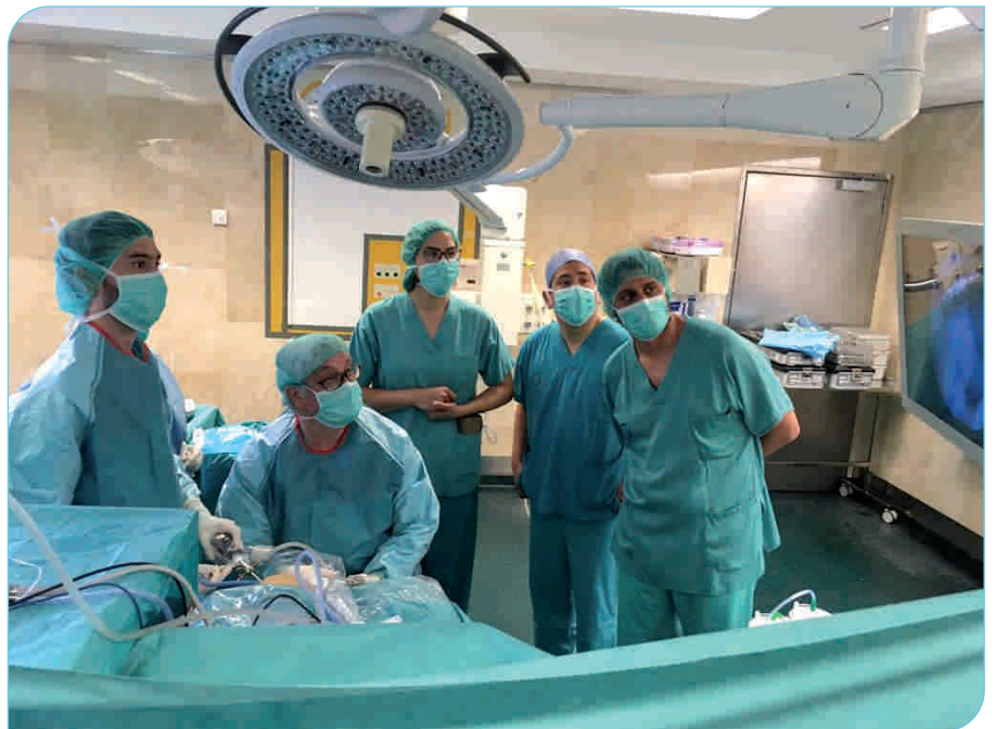
L'Hospital General de Granollers fa unes 200 artroscòpies a l'any

soluta reincorporació a les activitats prèvies a la lesió.