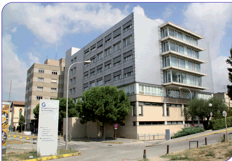
Les obres van començar al mes de març

Al mes de març, l'Hospital va començar les obres de remodelació