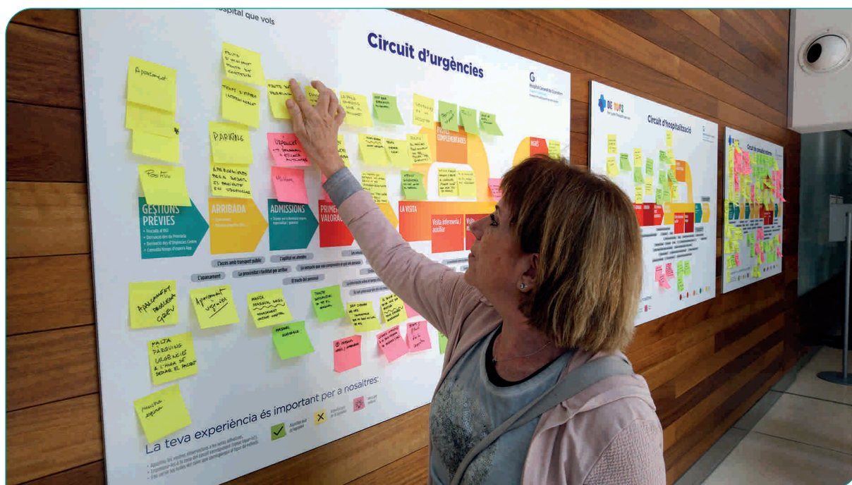
Una usuària aportant la seva opinió pel que fa al funcionament de l'Hospital, durant la Jornada de Portes Obertes