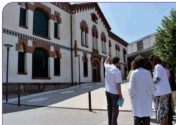
La consellera, en un moment de la visita a les instal·lacions de l'FPHAG