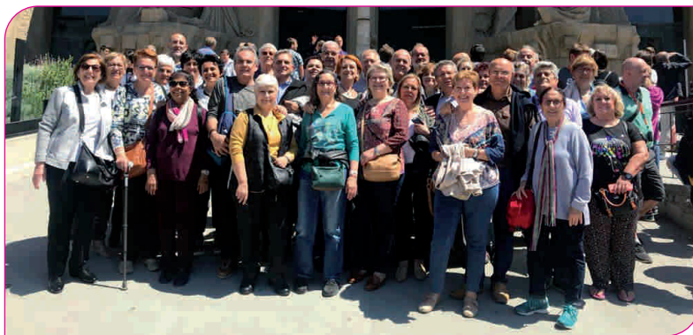
La sortida per visitar la Sagrada Família de Barcelona va tenir tant d'èxit que es van haver de fer dos grups

diferents segons l'hora del dia. Tots vam poder comentar la meravella que havien pogut gaudir durant l'estona que va durar el recorregut comentat.