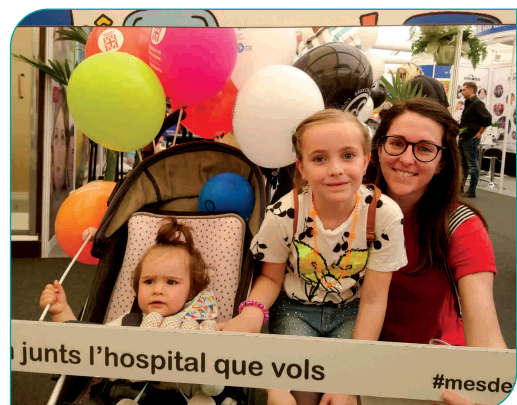
Una família a l'estand de l'Hospital de la Fira de l'Ascensió 2019

D'altra banda, del 30 de maig al 2 de juny, l'Hospital General de Granollers també va disposar d'un estand a la Fira de l'Ascensió, on els usuaris podien fer-se fotografies amb un photocall que tenia impresa la imatge del projecte "Més de Tots". Un total de 133 fotografies es van fer públiques a la xarxa social Instagram, amb l'etiqueta #mesdetots .