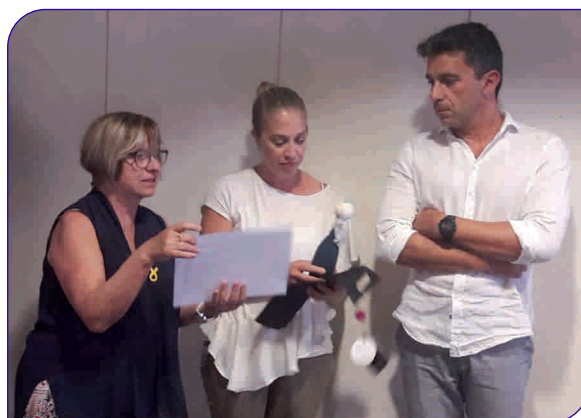
Representants de l'equip d'infermeria de Pediatria, recollint el reconeixement