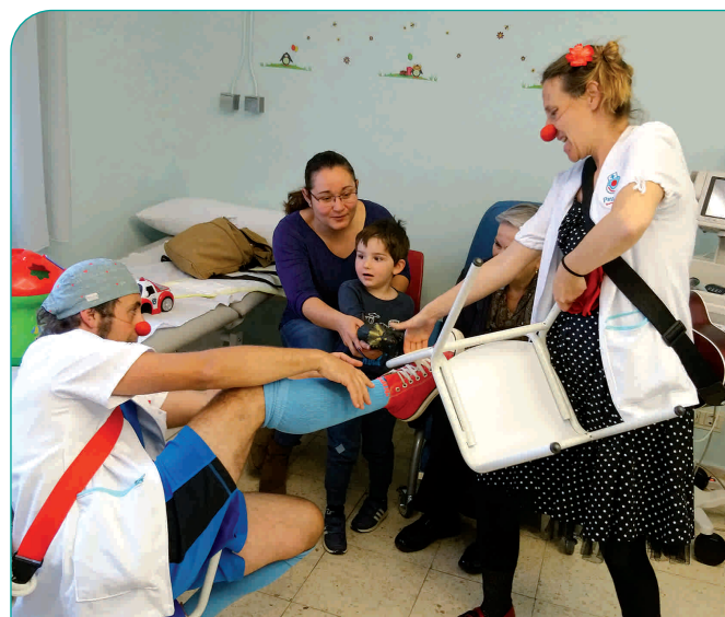
Els Pallapupas a l'Hospital de Dia Pediàtric, durant la Jornada de Portes Obertes