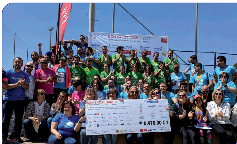
Enguany es van recaptar 6.470 euros a l'Olimpiada Solidària del sector de la salut i la recerca

Durant el mes d'abril van tenir lloc les competicions de l'olimpiada solidària Barcelona Salut Games, en què hem participat per segon any consecutiu. Més de 80 professionals de l'Hospital hi van competir defensant la samarreta del nostre centre, demostrant ser gent activa per solidaritat. Vam guanyar el Premi a l'eficiència esportiva (millor puntuació respecte dels equips participants), vam quedar 5ns en la classificació general, i també 3rs i 4ts en la prova de gimcana urbana, 2ns en bowling, 3rs en futbol i 3rs i 5ns en pàdel. En total, a les Olimpíades Solidàries s'han recaptat 6.470 €, que aniran destinats a deu accions socials.