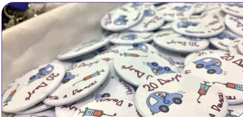
L'acte de celebració de l'aniversari va tenir lloc a l'aula de docència de l'Hospital

Aquest servei permet a pacients que pateixen un problema puntual de salut evitar l'ingrés i fer l'hospitalització al seu domicili amb la visita i seguiment d'equips mèdics i d'infermeria.