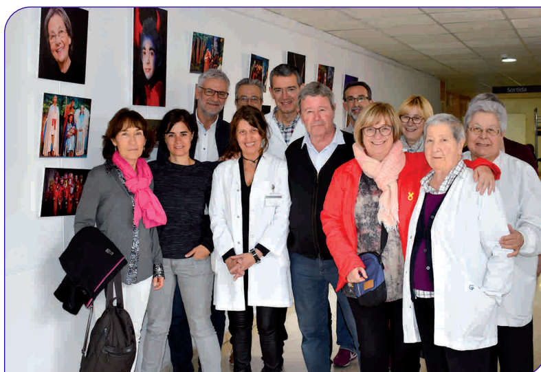
Els Pastorets de l'Hospital fa més de 30 anys que es representen

ca de la fotografia amb les caminades per la natura.