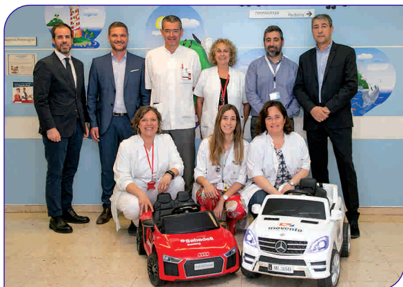
Sabadell Renting i Movento també van regalar cotxes teledirigits al servei de Pediatria