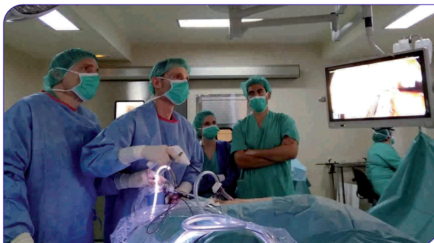
La Unitat de Cirurgia Endocrina de l'Hospital fa servir la tècnica de l'adrenalectomia laparoscòpica retroperitoneal posterior