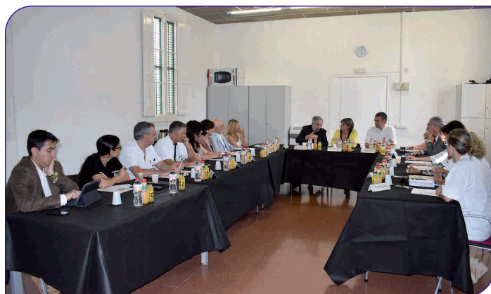
La consellera també es va reunir amb l'equip directiu i membres del patronat de l'FPHAG