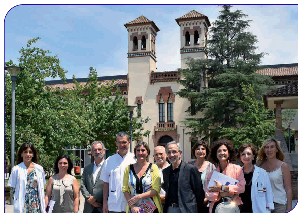
La consellera de Salut, Alba Vergés, va visitar l'Hospital el 18 de juliol

La consellera també va poder veure l'espai on s'edificarà el nou centre de radioteràpia, que donarà servei al Vallès Oriental i Osona i als municipis de l'eix de la C-17. En la construcció i posada en marxa del nou equipament intervenen el nostre hospital, l'Ajuntament de Granollers i el Consorci Hospital Clínic de Barcelona (HCB), tot i que totes les parts treballaran de forma conjunta per implicar altres actors que facin viable econòmicament el projecte. S'estima que el nou centre de radioteràpia entrarà en funcionament durant l'any 2021.