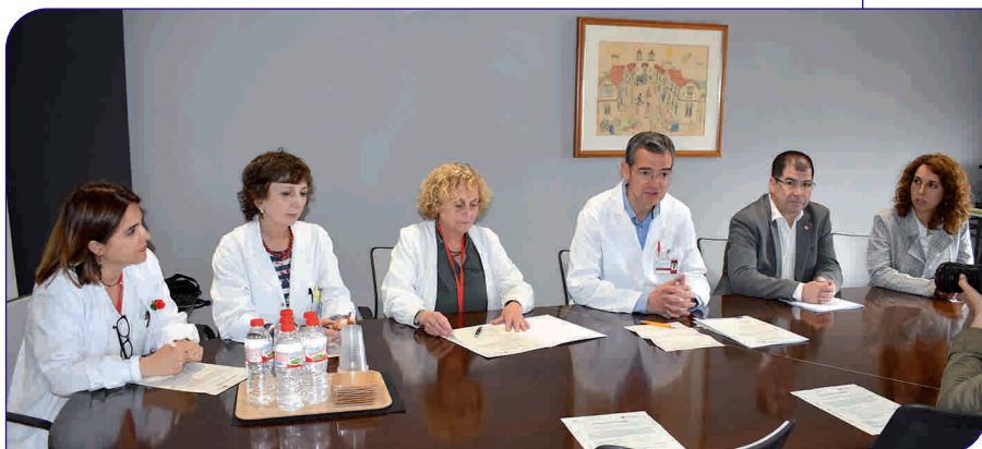
Acte de signatura de l'acord de col·laboració amb Creu Roja Granollers

Per tal d'alleugerir l'experiència de patiment provocada per la soledat en persones que es troben en situació de malaltia avançada, la Fundació Privada Hospital Asil de Granollers (FPHAG) i Creu Roja Granollers han decidit col·laborar en el marc del projecte de voluntariat Soledat al final de la vida. Amb aquesta iniciativa es vol fomentar l'acompanyament de persones voluntàries: l'FPHAG detectarà els beneficiaris del projecte que es trobin en situació de soledat i final de la vida i els derivarà a la coordinadora de la xarxa de voluntariat de la Creu