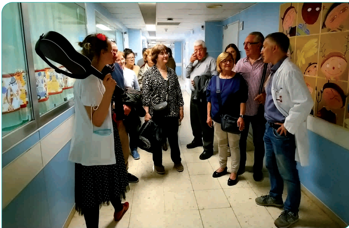
Un moment de la visita guiada per l'Hospital, durant la Jornada de Portes Obertes