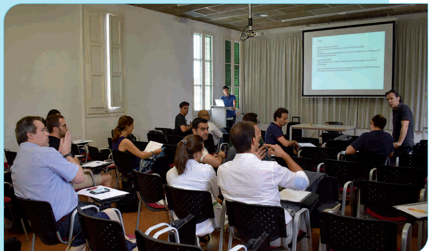
Un moment de la jornada que va tenir lloc a l'aula de docència de l'Hospital

El grup català d'espatlla està format per tots els cirurgians d'espatlla dels hospitals de Catalunya i té un propòsit científic i metodològic. Revisen articles d'espatlla, la metodo-