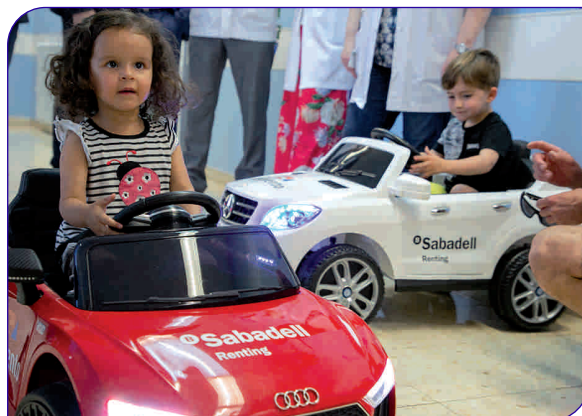
Dos infants provant els cotxes que van donar Sabadell Renting i Movento a l'Hospital