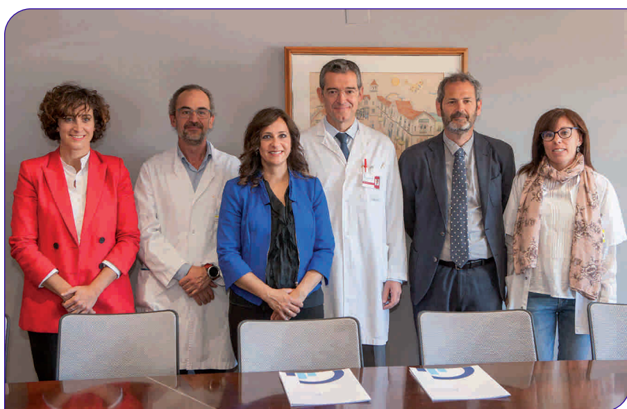
Representants de Roche Diabetes Care i de la Fundació Privada Hospital Asil de Granollers, el dia de la signatura de l'acord

de manera conjunta en futurs projectes d'innovació.