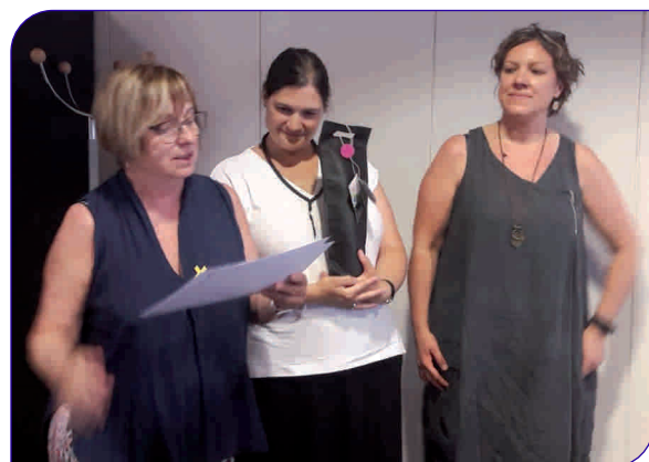
Un moment de l'atorgament del guardó a la Comissió de Lactància de l'HGG

D'altra banda, un premi a la innovació per a la Comissió de Lactància de l'Hospital, per l'impuls a la lactància materna des de l'any 2007, que actualment componen membres de diferents disciplines i centres d'atenció. Pel treball en equip que desenvolupen, que ofereix una atenció integral a la dona i al nadó en l'alletament matern i aconsegueix una millor comunicació entre primària i hospital, revisant i unificant pautes d'actuació.