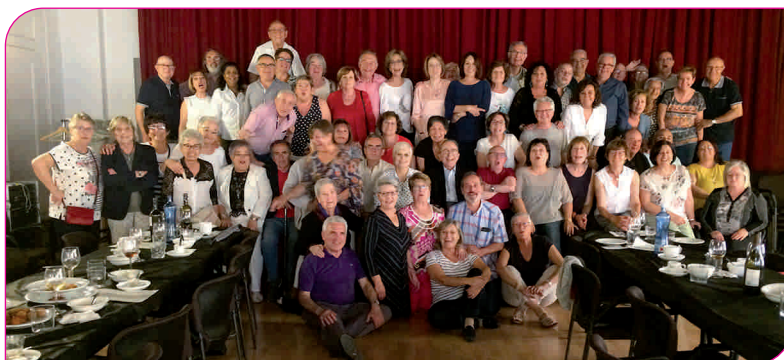
Com cada any, l'associació va fer el dinar anual al restaurant El Trull, del Casino de Granollers

amb el retrobament d'antics companys de l'hospital.